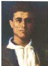
Błogosławiony - Piotr Jerzy Frassati, świecki dominikanin.